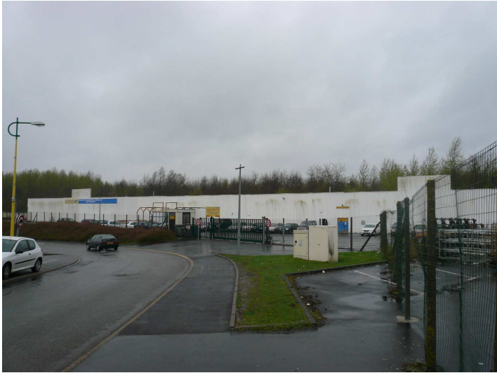
Vue de face du bâtiment