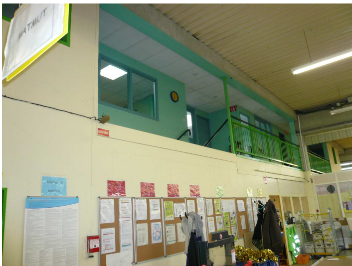
Vue de la mezzanine bureaux