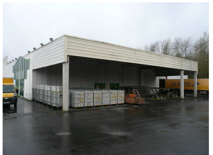
Vue de l'auvent côté droit (200 m 2 ) et l'accès à la réserve