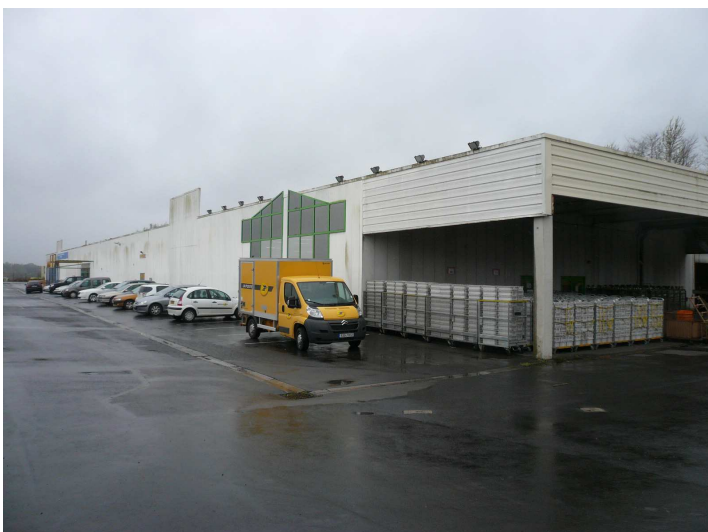
Vue de l'avant et du côté droit avec auvent