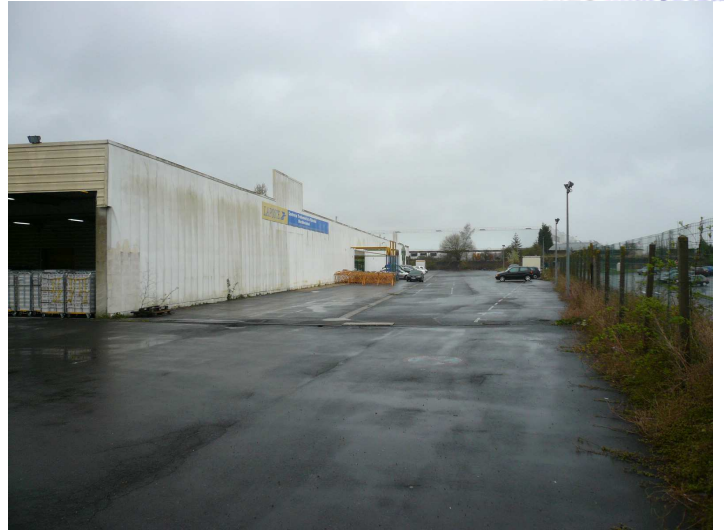
Vue de l'avant depuis le côté gauche