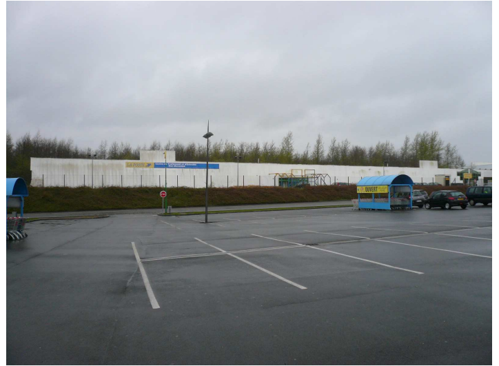
Vue de face du bâtiment depuis le parking LORY

Situation du bâtiment dans la zone commerciale :