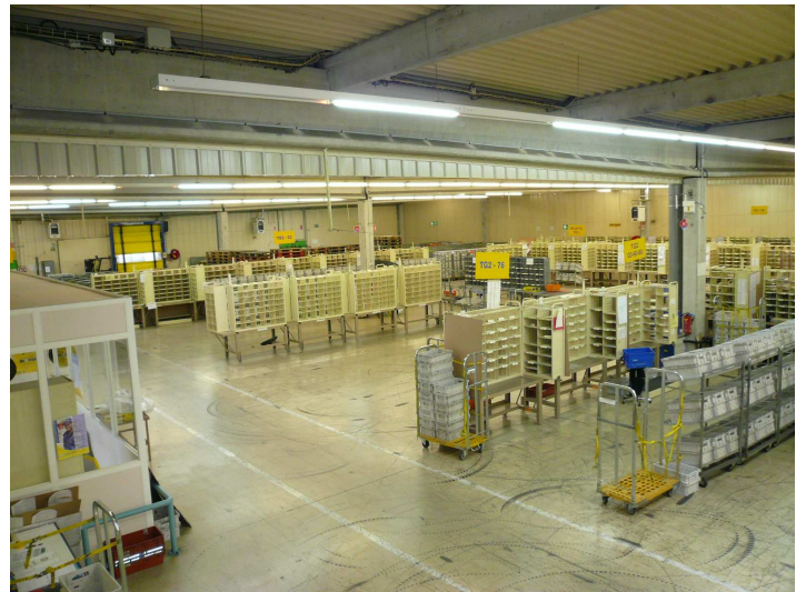
Vue intérieure depuis la mezzanine bureaux