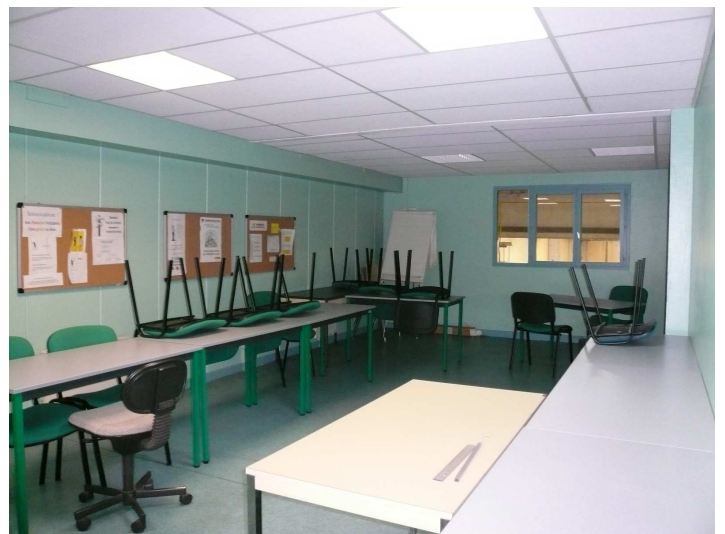
Un bureau en mezzanine