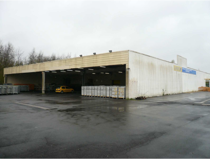
Vue de l'auvent côté gauche (800 m2)